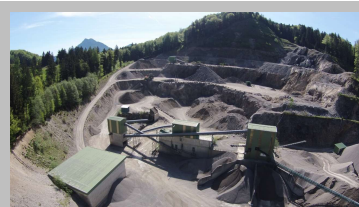
Werk Hof bei Salzburg Hinterseestraße 1 5322 Hof bei Salzburg Tel.: 06229/ 27 83