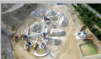
Werk Schwarzmoos Stelzen 80 4923 Lohnsburg am Kobernaußerwald Tel.: 0662/85 04 58-49

Alle Preise verstehen sich excl. 20% MwSt. | Preisliste gültig ab 01.03.2025